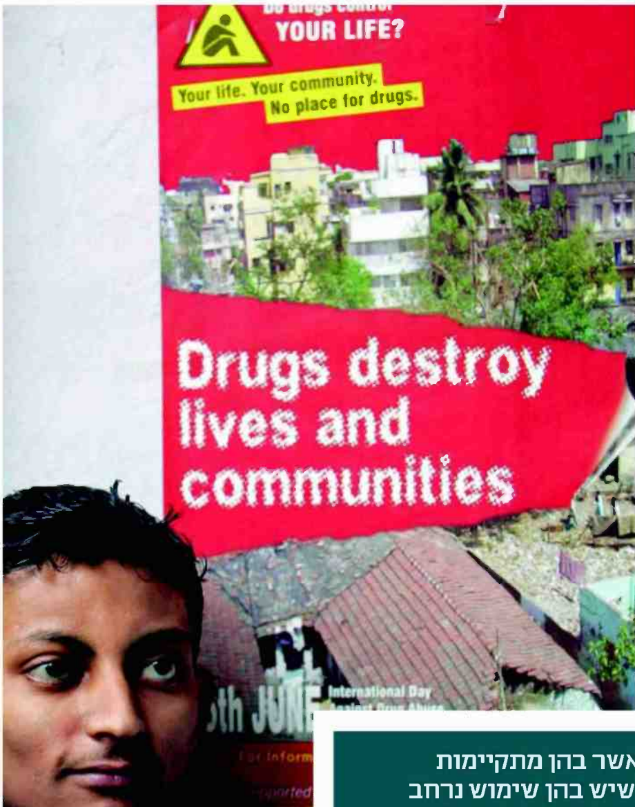
מתוך קמפיין נגד סמים

טיולי הפלמ"ח, החלה להתפתח מסורת של מסעות יחידים וחבורות קטנות. מסורת זו התגבשה בשנות החמישים ומייצגה המובהק ביותר הוא מאיר הרציון, שלאחר מסעו הראשון למצדה כתב: "יש לציין כי במסעות גדולים חסרה החוויה שבטיול. אין אתה עומד ברשות עצמך ועושה ככל העולה על רוחך (...). לכן אין הטיולים המאורגנים מעניינים ומושכים. סתם לצעוד ככבשה, אין טעם".