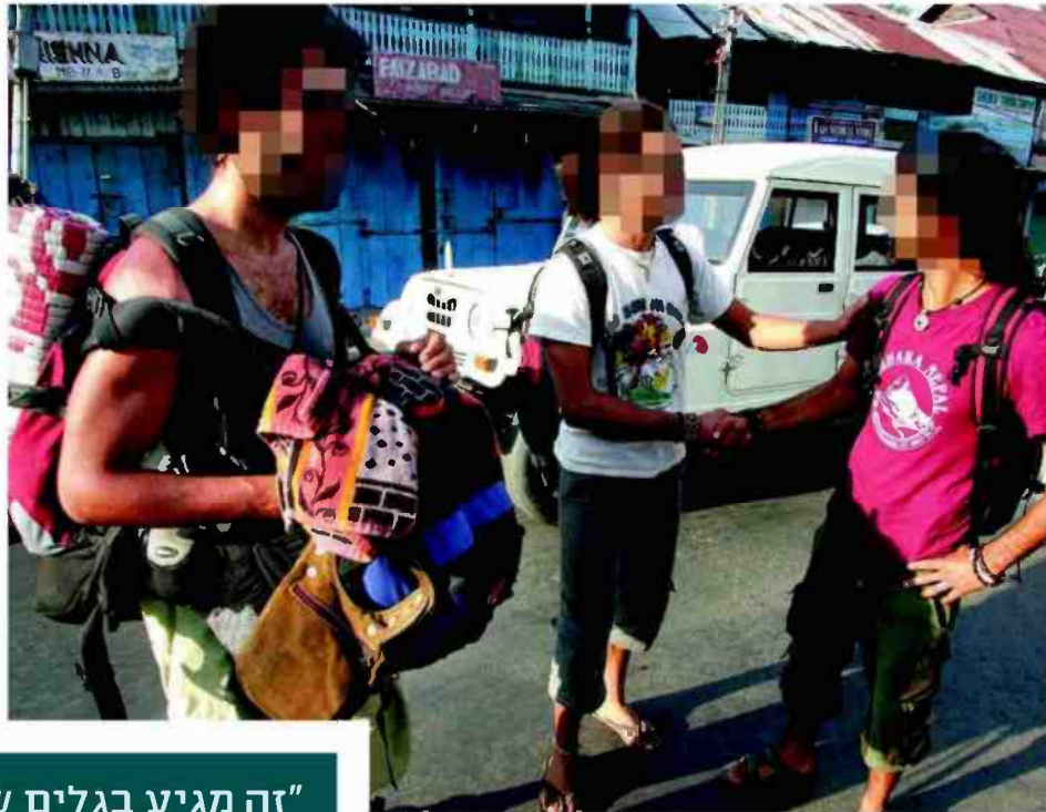
מתמודדים עם הזיכרונות מהצבא בעזרת סמים. למצולמים אין קשר לכתבה

"זה מגיע בגלים של תגובות פוסט טראומה במיוחד לאחר אירועים גדולים - מלחמת לבנון השנייה, מבצע עופרת יצוקה ועוד חוויות רבות וקשות שעוברים בעיקר לוחמים במהלך השירות. תופעות שמתפרצות לאחריו במהלך הטיול ועם התחלת השימוש בסמים"