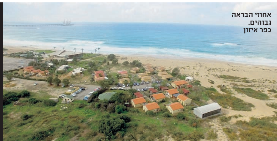
אחוזי הבראה גבוהים. כפר איזון

עודד: "נתקלנו, חטפתי שני כדורים בבטן ולמרות זאת הצלנו את המפקד שלי, והרגנו את אחד המהבילים. הסתובבנו בתחושה של רמבו בלי להתייחס לסיוטים בלילה ולפחד מהחושך"